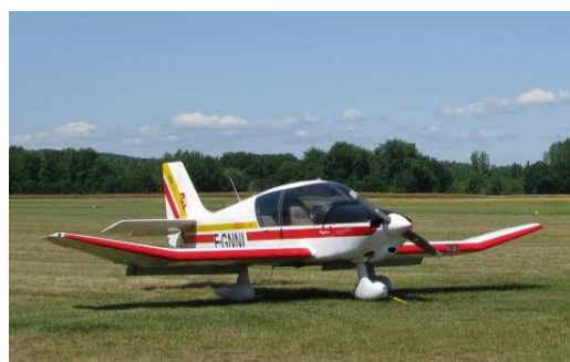
Votre incontournable compagnon de voyage !