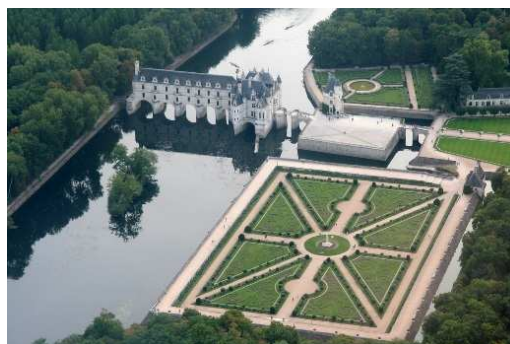
Château de Chenonceau