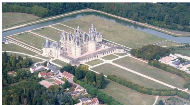
Château de Chambord

Cette journée ouverte à tous conviendra en particulier à tous ceux qui sont curieux de découvrir le vol en avion de tourisme, sans s'engager sur un long voyage.